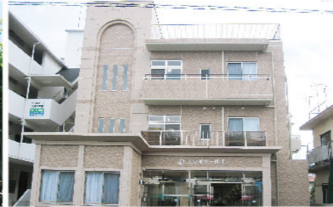
グループホーム大学通り 【定員18名・全室個室】 TEL.0977-27-9020(2F) 0977-27-9030(3F)