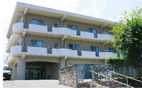
グループホーム新別府 【定員18名・全室個室】 TEL.0977-75-9382(2F) 0977-75-9383(3F)